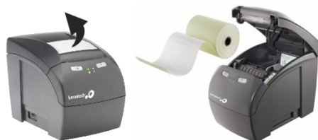
IMAGEM MÉRAMENTE ILUSTRATIVA

Para inserir o papel na impressora, puxe a alavanca e levante a tampa conforme indicado na figura. Coloque o papel com a parte amarela (têrmica) para baixo, fazendo contato com a cabeça térmica e feche a tampa da impressora.