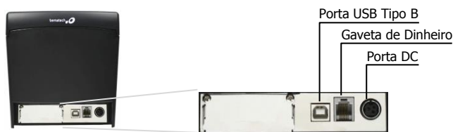
IMAGEM MÉRAMENTE ILUSTRATIVA