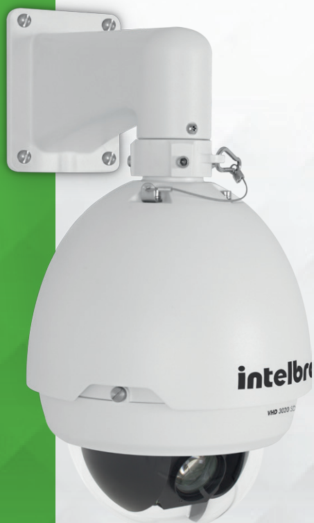
Câmera HDCVI speed dome